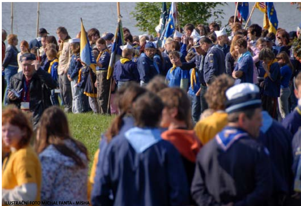
ILUSTRÁČNÍ FOTO MICHAL FANTA - MISHA