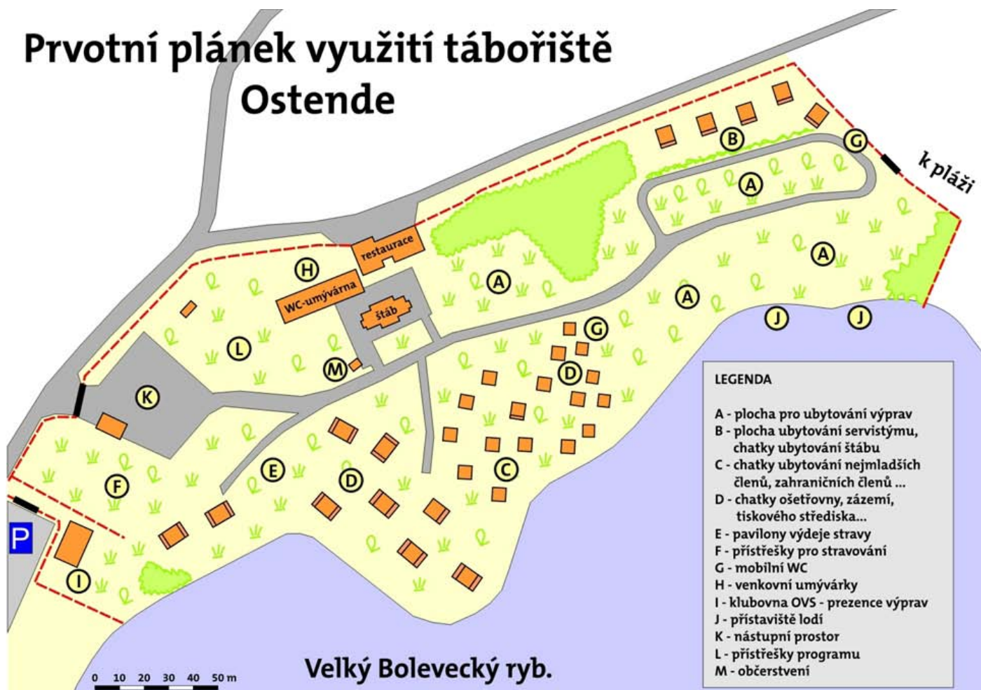
Plánek tábořiště Navigamu 2012