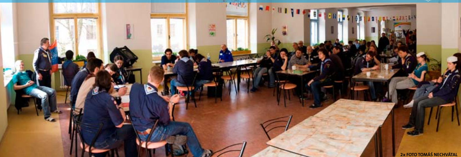
2x FOTO TOMÁŠ NECHVÁTAL